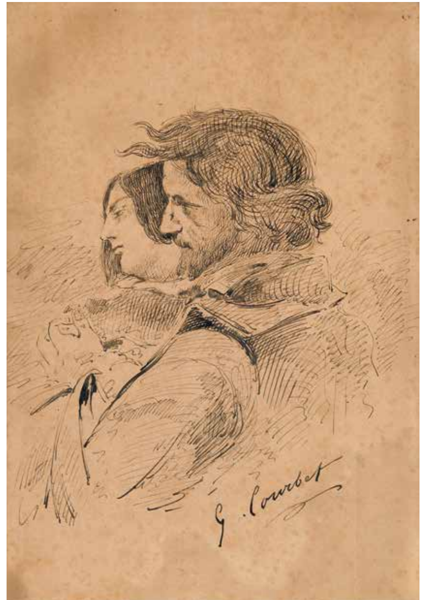
Gustave Courbet (1819–1877) Les Amants dans la campagne , 1867 Encre sur papier, 287 × 200 mm Collection Musée départemental Gustave Courbet

Une exposition en partenariat avec le Musée Courbet d'Ornans, et en collaboration avec la Commune de La Tour-de-Peilz, à l'occasion du bicentenaire de la naissance de l'artiste