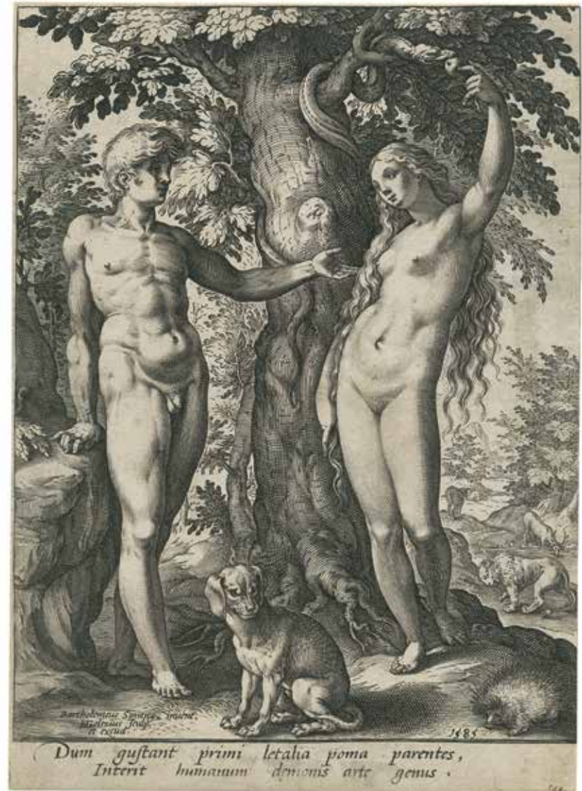
Hendrick Goltzius (1558 – 1617), d'après Bartholomeus Spranger (1546 – 1611) Adam et Ève , 1585 Burin sur papier vergé, 200 × 153 mm Musée Jenisch Vevey – Cabinet cantonal des estampes Collection du Musée Alexis Forel

Une exposition du Cabinet cantonal des estampes, sous le commissariat de Florian Rodari