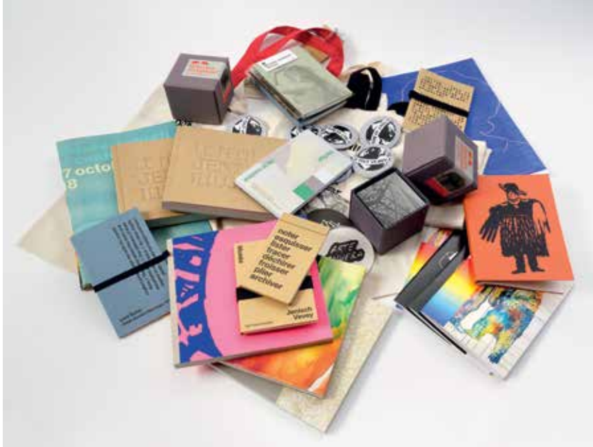
À la boutique, une sélection d'objets très « papier », tous réalisés en exclusivité pour le Jenisch !

Retrouvez un grand choix de catalogues, ainsi qu'une sélection de livres en écho aux expositions, en collaboration avec Payot. Mais aussi de rares éditions d'artistes, de beaux crayons de couleurs, des carnets réalisés à partir des affiches du musée par la relieuse d'art Nathalie Compondu de l'Atelier 20 à Vevey, la collection Carnet Numéro et les Tote bags en édition limitée, les cahiers de coloriage WiZZZ , les agendas et les créations de plein papier à Lausanne, , des kits de gravure, des cartes postales... et beaucoup d'autres articles pour redécouvrir les plaisirs d'écrire, de dessiner et d'offrir.