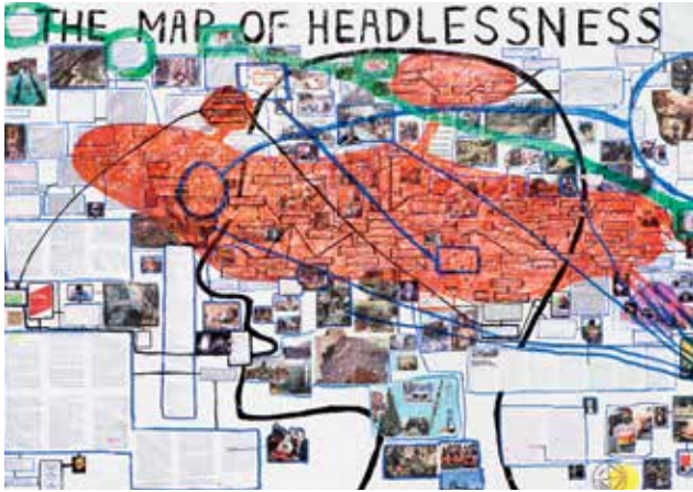
Thomas Hirschhorn (*1957) et Marcus Steinweg (*1971) The Map of Headlessness , 2011 Technique mixte, 401 × 241 cm Musée Jenisch Vevey © 2018, ProLitteris, Zurich Photo Julien Gremaud

Achetée par le musée en 2015, la monumentale Map of Headlessness , réalisée en 2011 par Thomas Hirschhorn (* 1957), est exposée en primeur du 16 janvier au 24 février 2019.