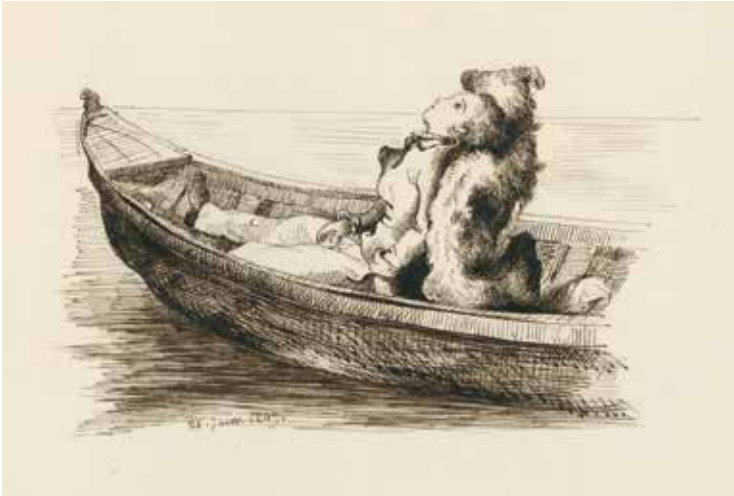
Ce dessin est à découvrir dans l'exposition Dessin politique, dessin poétique , conçue par Frédéric Pajak, jusqu'au 24 février 2019. Charles Schroeder (actif entre 1834 et 1900) Jeune garçon sur une barque, adossé à son chien , 1849 Encre brune et crayon, 168 x 257 mm Musée Jenisch Vevey

Avant d'accueillir la nouvelle direction du Musée Jenisch, l'équipe prend congé de Michel Cap, fidèle et ô combien précieux technicien des collections qui encadre, accroche et prend soin des œuvres depuis 28 ans. Merci, cher Michel.