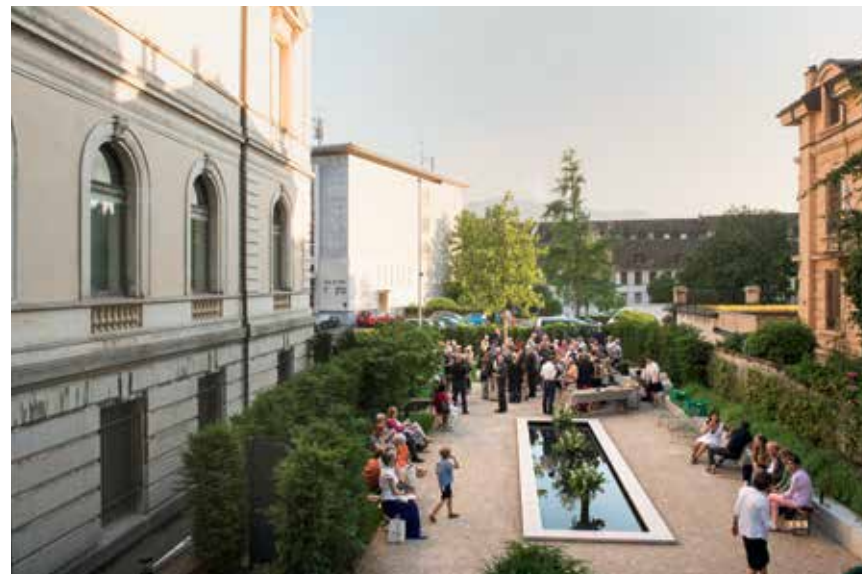
Vernissage des expositions Picasso Lever de rideau et En selle! Kokoschka et les équidés 20 juin 2018

Amateur d'art, vous suivez avec attention et fidélité les expositions et la vie du musée ? Vous appréciez l'esprit de découverte du Jenisch et souhaitez contribuer personnellement à son développement ?