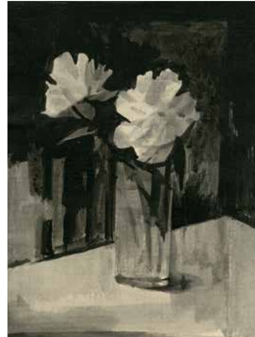
Gérard de Palézieux (1919 – 2012) Deux pivoines , non daté Lavis, 320 × 228 mm Musée Jenisch Vevey – Cabinet cantonal des estampes Fondation William Cuendet & Atelier de Saint-Prex © Les ayants droit

La Fondation William Cuendet & Atelier de Saint-Prex et la Fondation Custodia à Paris se réjouissent d'annoncer l'exposition qui sera consacrée à Gérard de Palézieux (1919 – 2012), à l'occasion du centenaire de sa naissance, du 21 septembre au 15 décembre 2019, pour l'étape parisienne, et présentée au Musée Jenisch – Cabinet cantonal des estampes, du 14 février 2020 au 24 mai 2020.