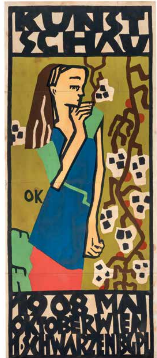
Oskar Kokoschka (1886 – 1980) Stehendes Mädchen in Weinranken [Jeune fille debout entre des sarments de vigne], 1908 (été) Lithographie en couleurs sur papier, 960 × 380 mm Fondation Oskar Kokoschka, Vevey © Fondation Oskar Kokoschka / 2018, ProLitteris, Zurich

Une exposition présentée dans l'Espace Kokoschka oskar-kokoschka.ch